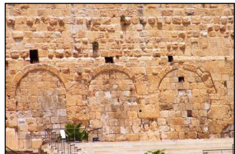
De drievoudige Huldapoorten.

Deze poorten werden in later tijd de Huldapoorten (שַׁעֲרֵי הַחֹלְדָּה, Sha’aré Choelda) genoemd, mogelijk naar de Profetes Hulda (Chulda) 11 .